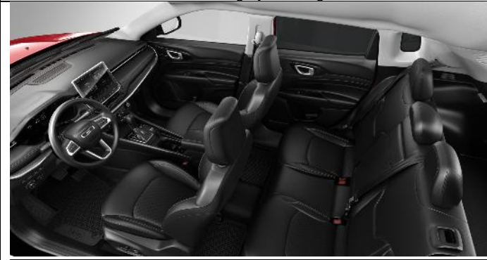
422 - Leather black with diesel grey stitching / Limited