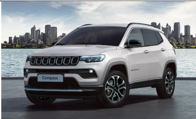
5CA - Vopsea pastel Alpine White