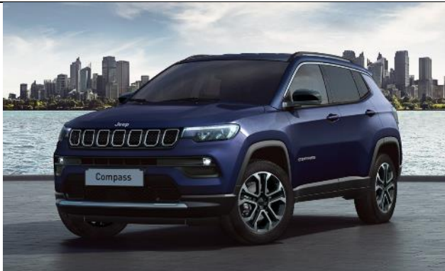
5DP - Vopsea metalizata Jetset Blue