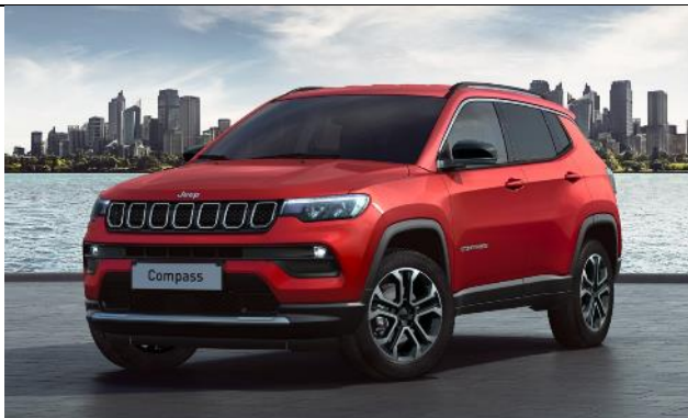
5CJ - Vopsea pastel Colorado Red