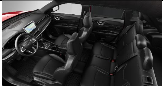
557 - Leather black with diesel grey stitching – ventilated / S