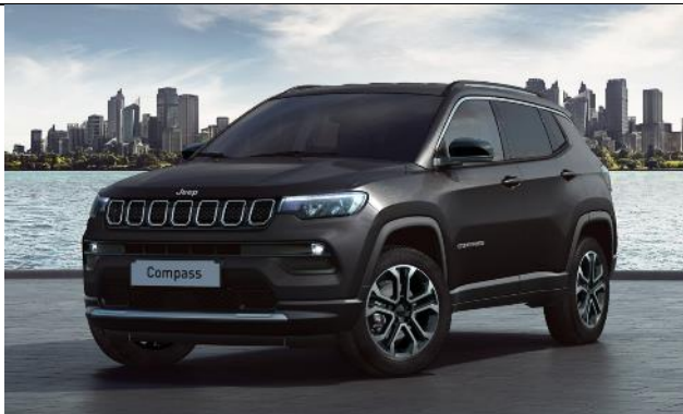
5CE - Vopsea metalizata Carbon Black