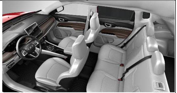
416 - Leather ski grey with diesel grey stitching / Limited