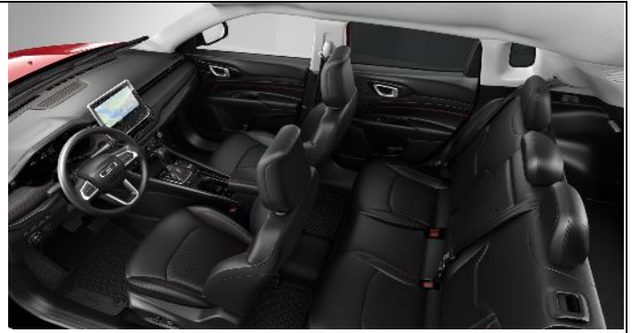
897 - Leather black with red stitching / Trailhawk