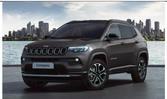
8CZ - Vopsea pastel Sting Gray