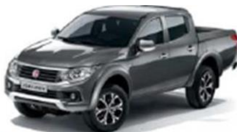
480 Titanium Grey