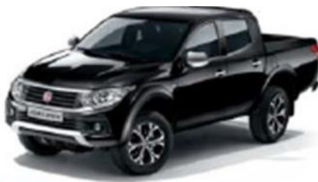
555 Black (Mica)