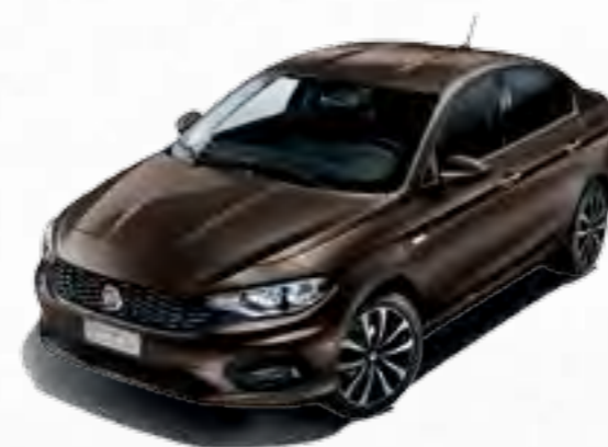
444 BRONZO MAGNETICO METALIZAT