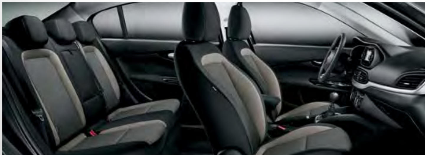
POP / EASY - TAPIȚERIE BICOLORĂ, TEXTURATĂ, ÎN NUANȚE DE GRI