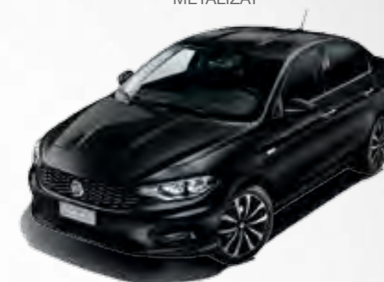
718 NERO CINEMA METALIZAT