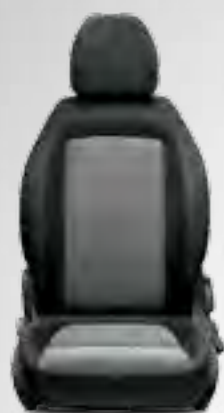
TIPO Tapițerie neagră cu insertii gri