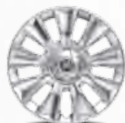
Capace roți 16"