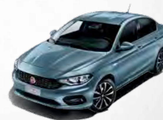
448 BLU CANALGRANDE METALIZAT