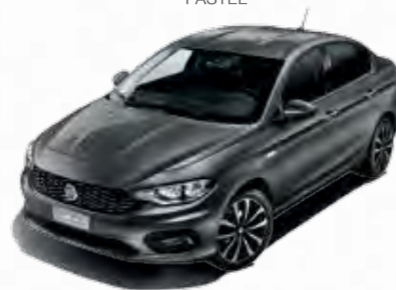
695 GRIGIO COLOSSEO METALIZAT