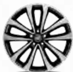
Jante de aliaj diamantate 17"