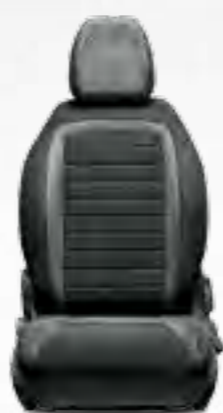
LOUNGE GRI Tapițerie cadrilată în nuanțe de gri