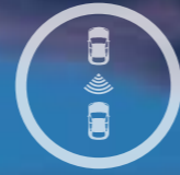
SENZORI DE PARCARE