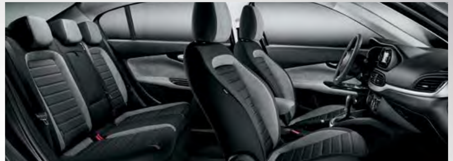
LOUNGE - TAPIȚERIE CADRILATĂ, ÎN NUANȚE DE GRI ȘI BEIGE