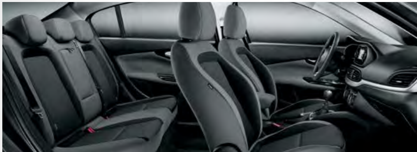
POP / EASY - TAPIȚERIE BICOLORĂ, TEXTURATĂ, ÎN NUANȚE DE GRI ÎNCHIS