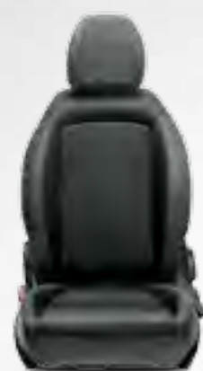
POP/EASY GRI ÎNCHIS Tapițerie bicoloră, texturată, în nuanțe de gri închis