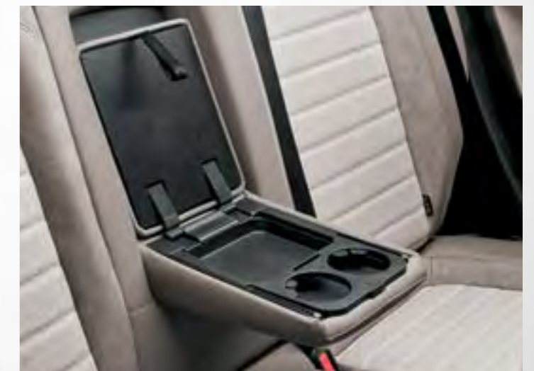
Cotieră centrală spate cu spațiu de depozitare și suporturi de pahare

Tot confortul de care ai nevoie, în 4.54 metri lungime. Noul Tipo îți aduce cel mai confortabil interior din clasa lui, oferind cinci locuri comode, cu susținere, cinci tipuri de tapițerie și o mulțime de spații de depozitare.