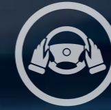
COMENZI PE VOLAN