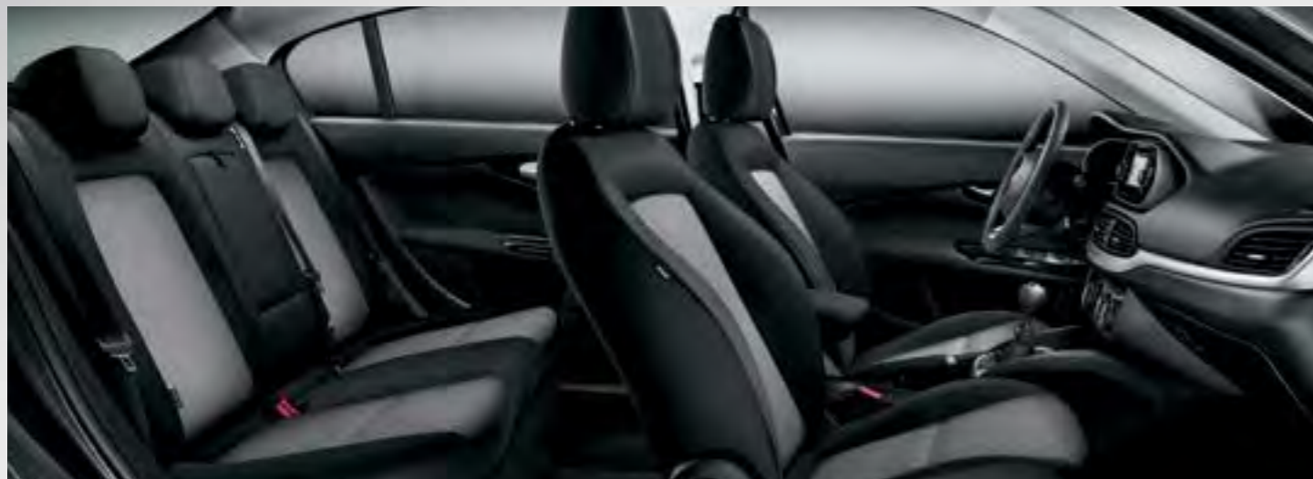
TIPO - TAPIȚERIE TEXTILĂ DE CULOARE NEAGRĂ, CU INSERȚII GRI