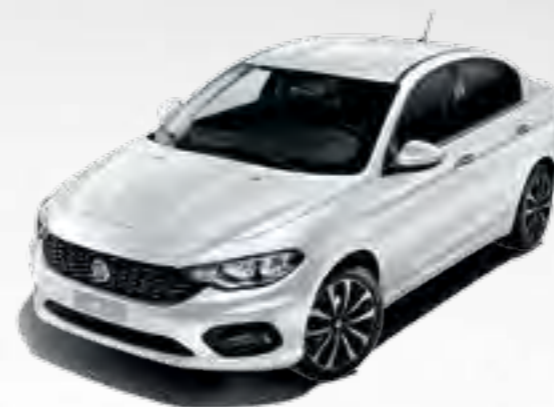
249 BIANCO GELATO PASTEL