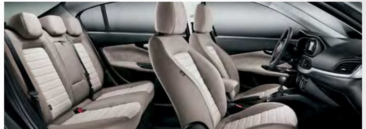
LOUNGE - TAPIȚERIE CADRILATĂ, ÎN NUANȚE DE GRI ȘI BEIGE