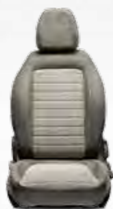
LOUNGE BEIGE Tapițerie cadrilată în nuanțe de beige