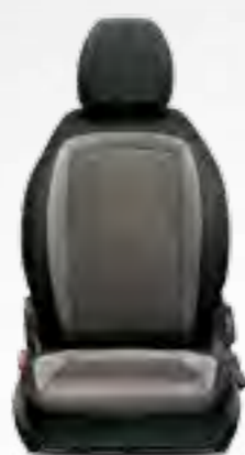
POP/EASY GRI Tapițerie bicoloră, texturată, în nuanțe de gri