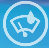
SENZORI DE PLOAIE