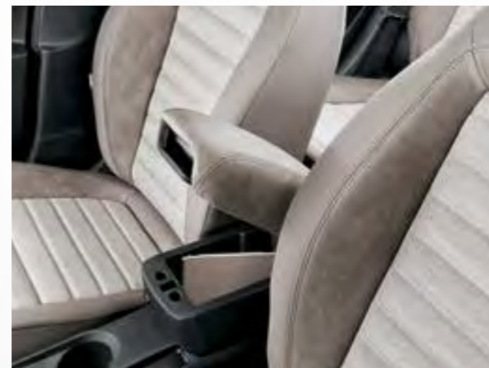
Cotieră cu spațiu de depozitare