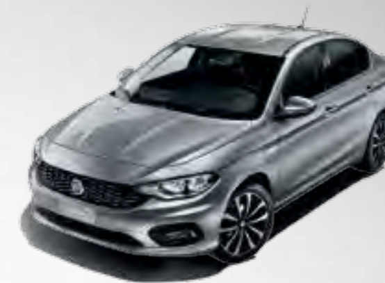
612 GRIGIO MAESTRO METALIZAT