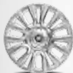
Capace roți 15"