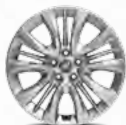
Jante de aliaj 16"